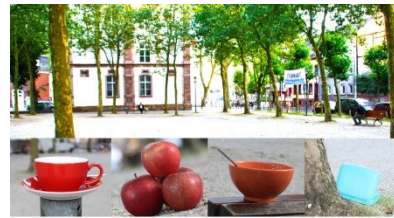
Draußen gemeinsam frühstücken und schwätzen. Freunde und Nachbarn, Jung und Alt, treffen sich.